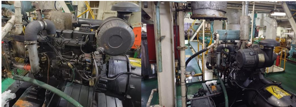
Motor N67 TM6 FPT Industrial en el buque Laizo