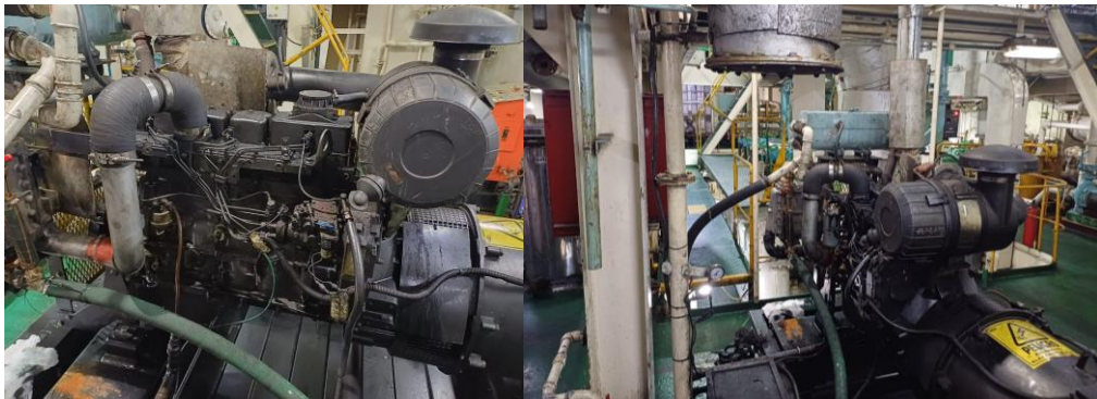
Motor N67 TM6 no navio Laizo

“Nosso relacionamento com a Compañía Fluvial del Sud S.A. é um exemplo claro de como a combinação de um produto confiável com um serviço de excelência nos permite acompanhar e aprimorar suas operações de forma sustentada”, afirma Fassio.