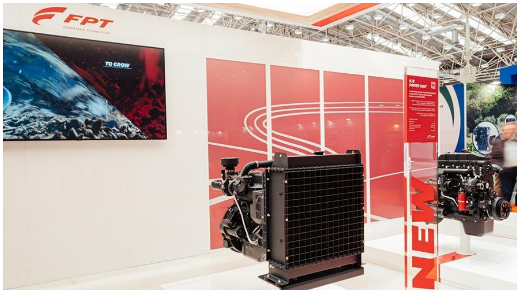
Novo R38 em exposição na EIMA 2024