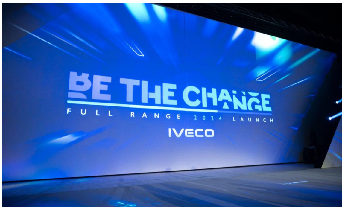
Lanzamiento del portfolio de productos 2024 en Barcelona, España.

Oficialmente presentados el 15 de noviembre en Barcelona, durante el lanzamiento del portfolio 2024 de IVECO e IVECO BUS en Europa, la actualización de las identidades de las marcas y los materiales de comunicación busca seguir el ritmo de la renovación de la gama de productos y servicios ofrecidos.