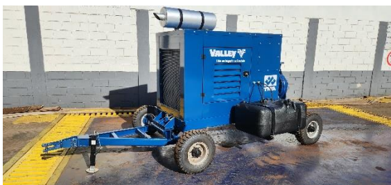
Motobomba FPT Valley

Fornecedora de soluções customizadas para diferentes tipos de missão, a FPT Industrial apresenta na Agrishow 2024, de 29 de abril a 3 de maio, em Ribeirão Preto (SP), uma motobomba desenvolvida com a Valley, um dos maiores fabricantes de sistemas de irrigação do mundo. A solução, alimentada por um motor G-Drive N67 TE5, da Série NEF, é flexível para uma grande variedade de formatos e aplicações no campo. Com um conjunto eficiente e robusto, torna-se assim muito útil em aplicações como irrigação em plantações.