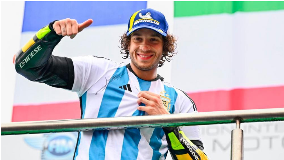
Marco Bezzecchi celebra el triunfo en el Autódromo de Termas de Río Hondo.

Marco Bezzecchi de Mooney VR46 Racing Team, se adjudicó el triunfo en la carrera final que disputó la máxima categoría en Argentina. De esta manera, el piloto del equipo patrocinado por IVECO, sumó su primera victoria en el historial personal.