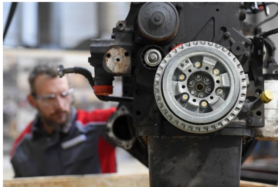
Reman FPT abrange 29 motores das famílias S8000, NEF e Cursor