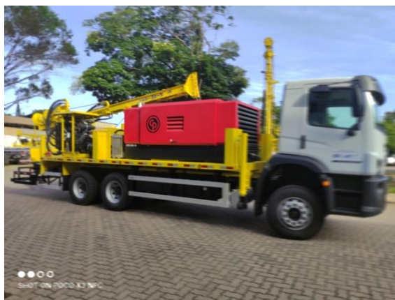
Sonda Prominas R-1SC equipada com motorização FPT

O equipamento foi adquirido pela Companhia Matogrossense de Mineração (METAMAT) e tem capacidade de perfuração de até 400 metros de profundidade.