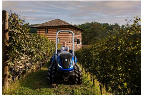
纽荷兰 (New Holland) TK 甲烷动力履带式葡萄园用拖拉机原型

在实际工况下，其排放量比传统拖拉机减少 80%，拥有众多环境优势，可降低高达 30% 的操作成本并减少振动。在可持续发展的农场中，生物甲烷可以产自废弃沼气或生物电厂。在良性循环中，牛粪等废弃物同样成为了宝贵的燃料来源。此外，为了在补充燃料和发动机燃烧期间实现更加清洁的处理，生物甲烷是一种随时可用型燃料，可供农民立即投入用于减少二氧化碳 (CO 2 ) 排放足迹。