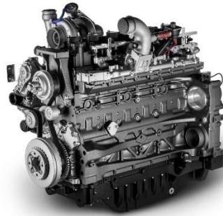
菲亚特动力科技 N67 天然气发动机

这一技术让农村生产商可以利用其农场内产生的沼气来为作业中的设备或其他车辆（如拖拉机和卡车）提供动力，从而实现所谓的“良性循环”。由于生物甲烷是由农业废弃物通过厌氧反应而产生，因此该循环的所有环节均为零碳排放足迹。除了降低操作成本外，该技术还使生产和燃料使用实现自给自足，从而促进了独立性的循环。